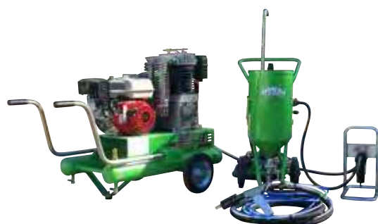
KIT TOPOLINO 18